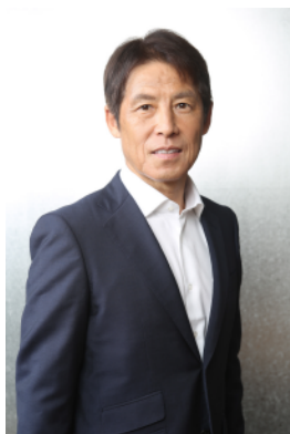
西野 朗 NISHINO Akira