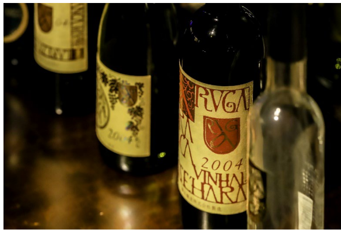
勝沼醸造アルガブランカ