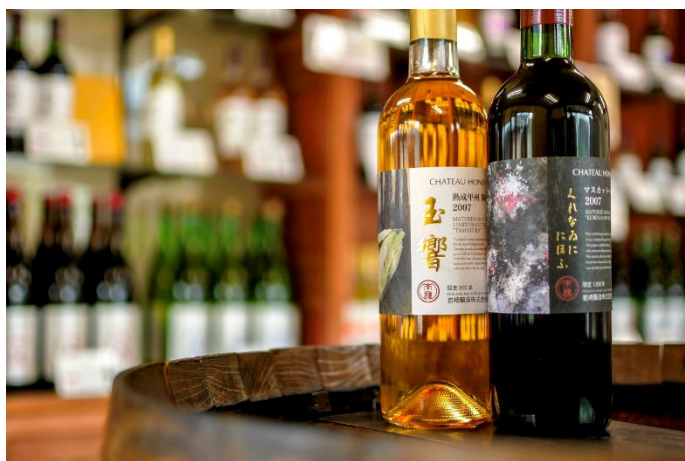
岩崎醸造ホンジョーワイン